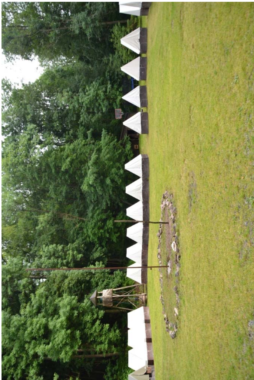
PRORUBKY - červenec 2024