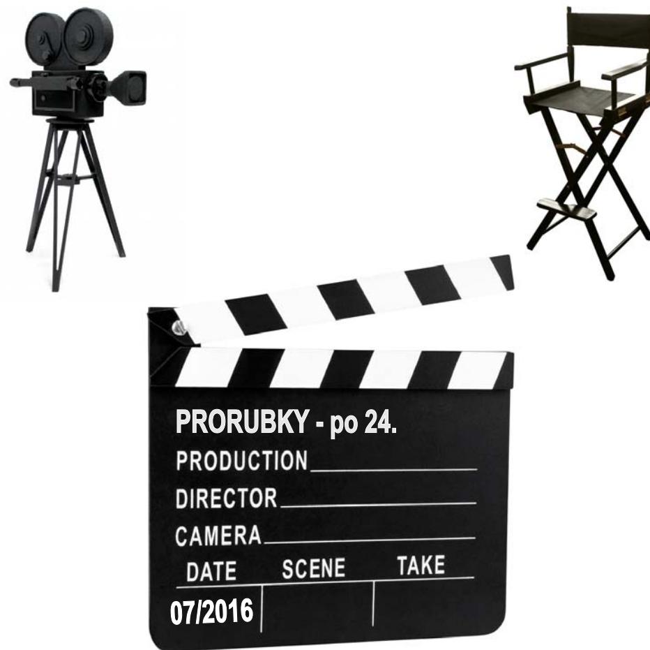
PRORUBKY - červenec 2016