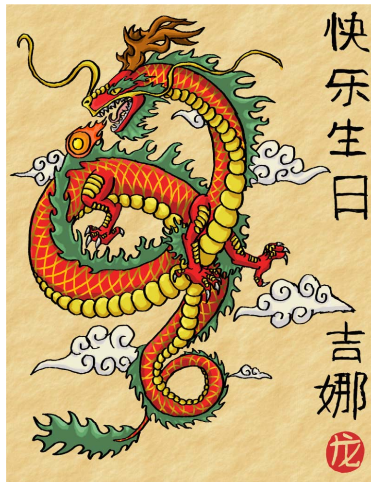
PRORUBKY - červenec 2018